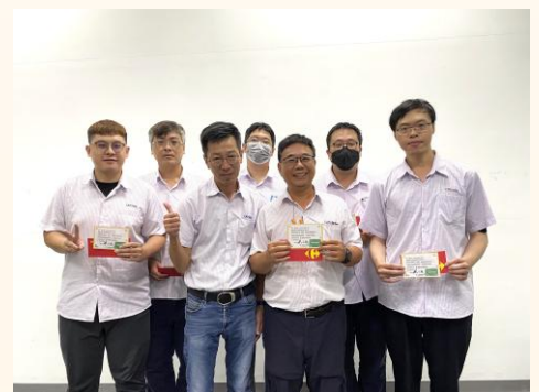
▲教師節內部講師感謝活動

為增進內部講師教學能力，使其勝任講師職責，所有內部講師皆經過一系列內部講師培訓課程：內部講師概念、內部講師實務、企業內部講師培訓，以每人至少18小時的培訓課程，建立內部講師適當的認知與態度，協助講師能以邏輯性的架構設計教材簡報，並善用多元教學方法與靈活的授課技巧，引發學員學習動機，達到內部知識與技術的傳承。